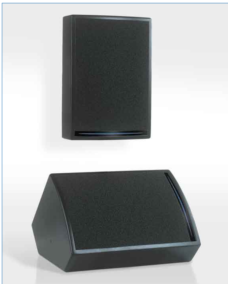
Enceintes MC2 présentées en façade et en retour de scène

La MC2 est une enceinte très compacte offrant une totale polyvalence entre les applications de façade avec ou sans caisson de basse et retour de scène.